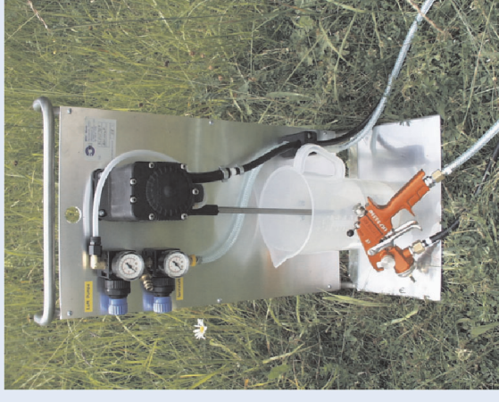
FlowJet mit Spritzpistole Optima 801