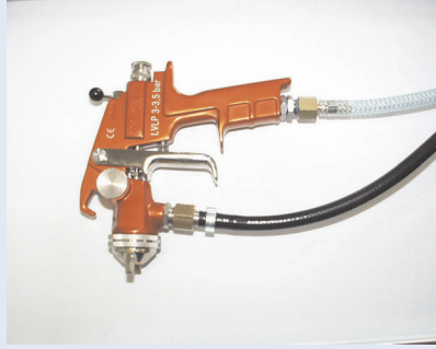
Spritzpistole Optima 801

Spritzpistole Nebelarm mit hohem Wirkungsgrad nach dem HVLP- System (hohe Luftmenge und wenig Druck), NR (Nebelreduziert) oder Konventionelle Hochdruckspritzpistole